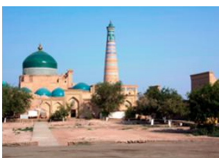
Tachkent 📍 ✈️ - ⌚ 1h 40m Ourguentch 📍 🚗 30km Khiva 📍